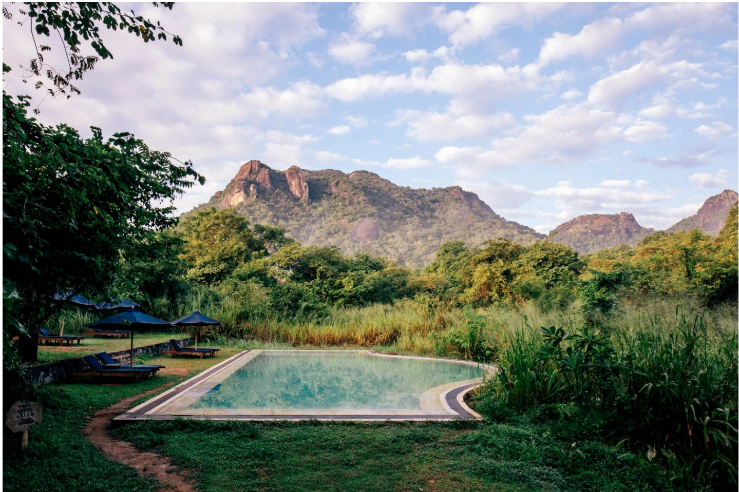
Gal Oya Nationalpark

Abschalten und relaxen in unberührter Natur.