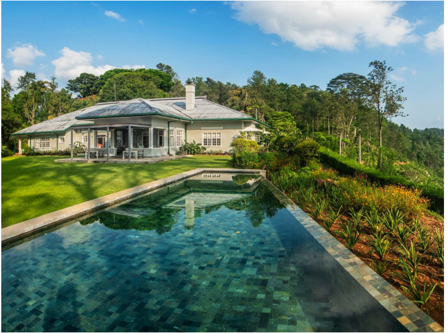
Demodara | Ella

Das elegante Boutique-Hotel bietet stilvolle Unterkünfte in einmaliger Natur mit unvergleichlichen Ausblicken, hochwertige Kulinarik und persönlichen Butler-Service.